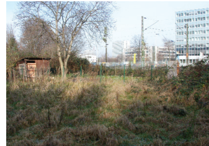
Testfläche im Innenbereich (Bonn-Dottendorf)

Zum Ende des REFINA-Projektes konnten erste Ergebnisse aus den Berechnungen des Portfoliomanagers vorgestellt werden. „Grundsätzlich schneiden integrierte Flächen besser ab als Flächen in der Peripherie“, resümiert Christian Koch, Mitarbeiter im Planungsamt beim Rhein-Sieg-Kreis. „Aber es geht nicht darum, bestimmte Flächen von vornherein für eine weitere Planung auszuschließen.“ In der Projektphase wurden mögliche Befindlichkeiten auf