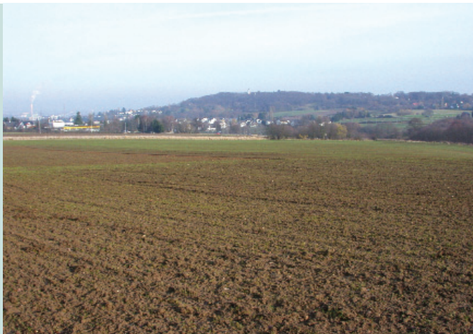
Ackerfläche in Bonn-Lengsdorf: eine Testfläche für die Entwicklung des Regionalen Portfoliomanagers